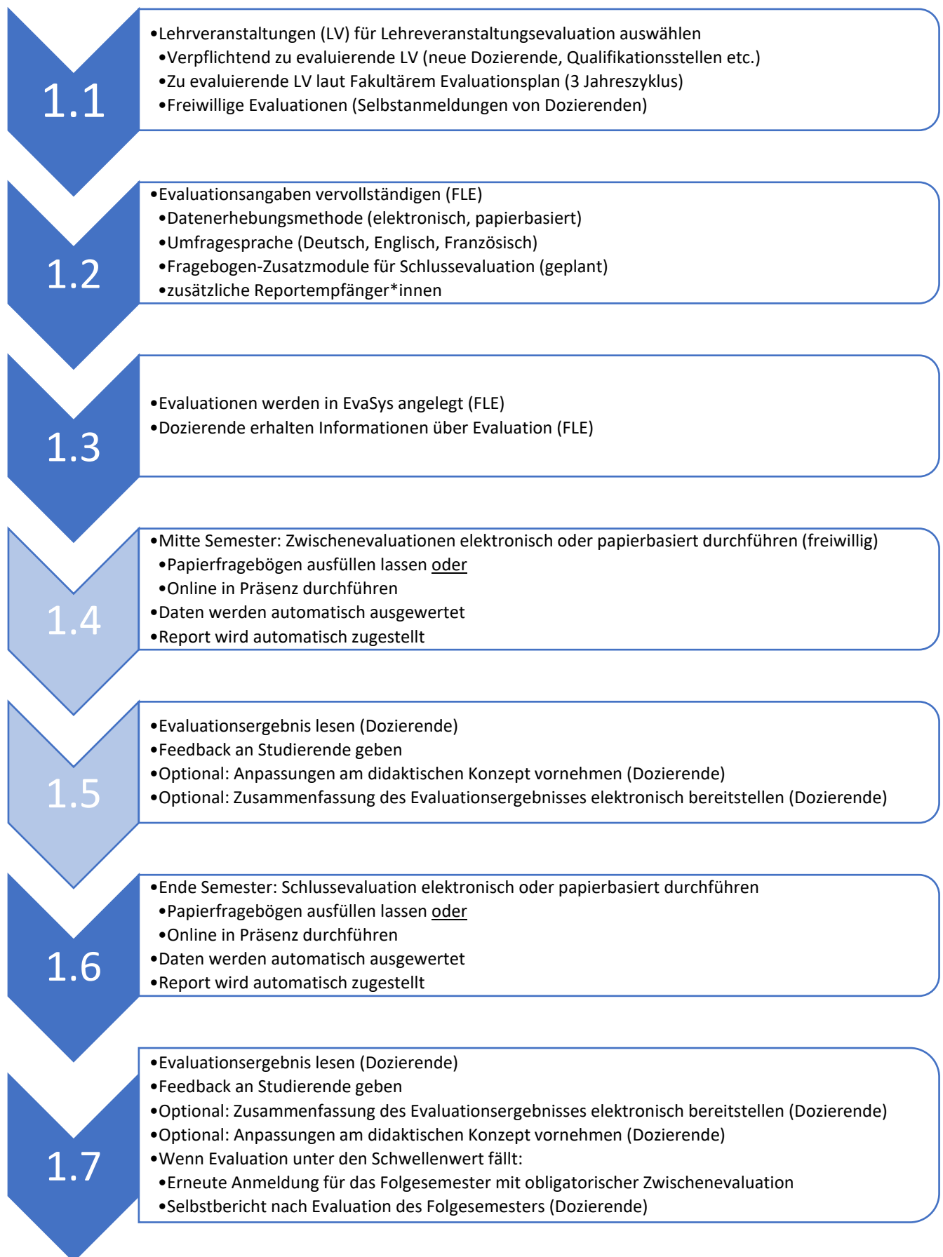
Abbildung 1: Ablauf Lehrveranstaltungsevaluationen (freiwillige Zwischenevaluation und Schlussevaluation)