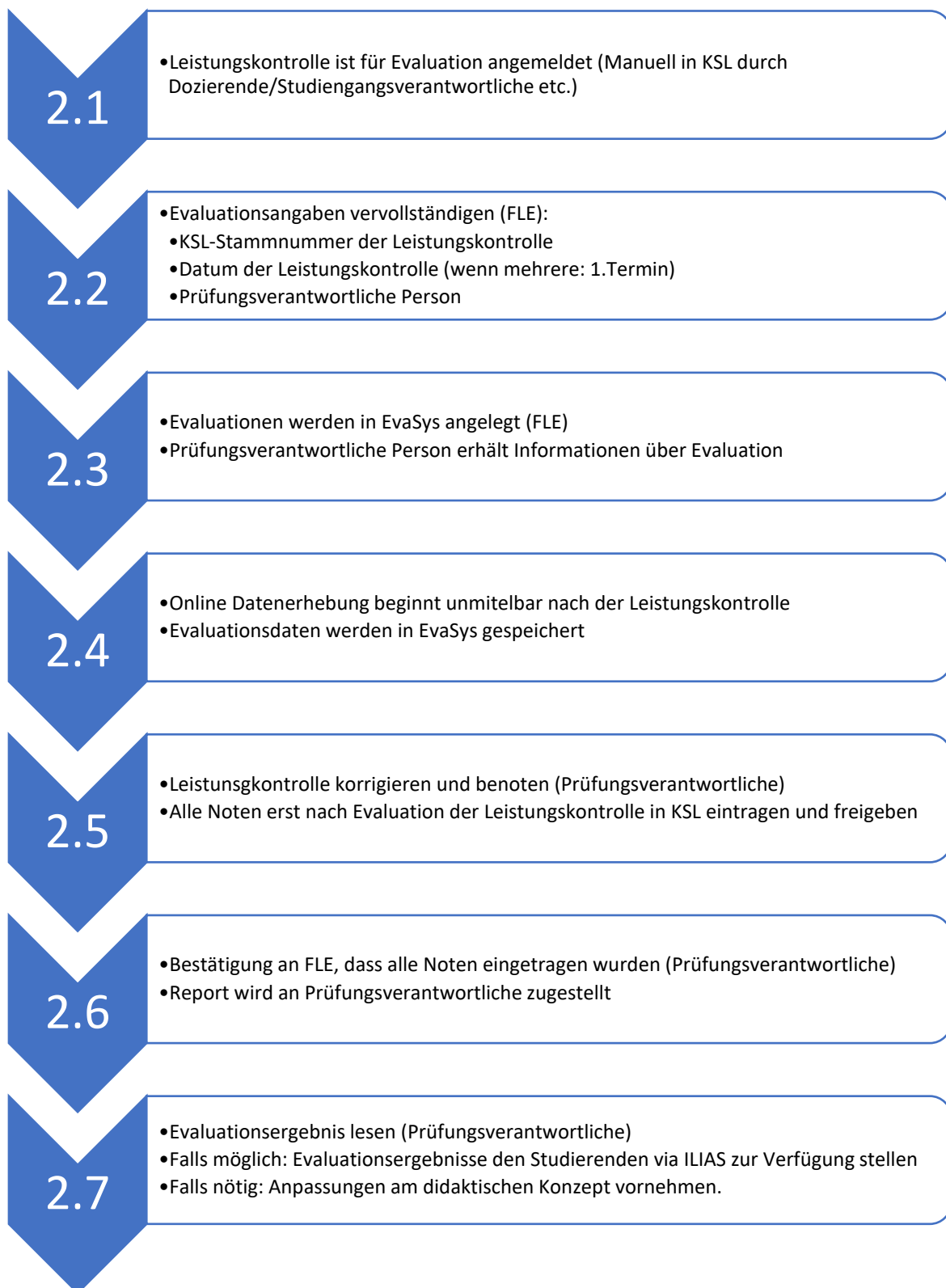
Abbildung 2: Ablauf Evaluation der Leistungskontrollen via Onlinefragebogen