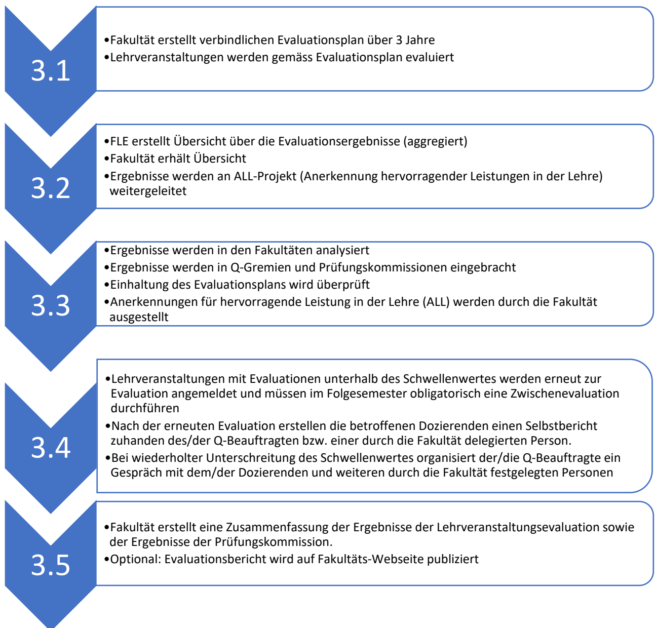
Abbildung 3: Ablauf Lehrveranstaltungsevaluationen auf Fakultätsebene

Ansprechpartner für die Fachstelle Lehrveranstaltungsevaluation sind immer die Q-Beauftragten der Fakultäten, die die Informationen entsprechend interner Vereinbarungen weiterverteilen können (fakultäre QSE-Richtlinien).